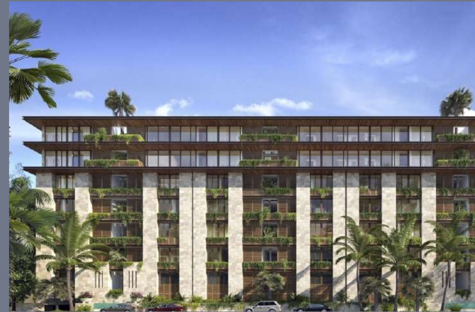
Punta del Mar Cancún, Quintana Roo