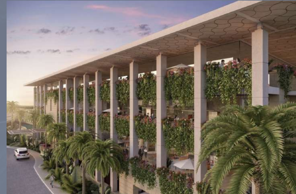
Port Marina Cancún, Quintana Roo