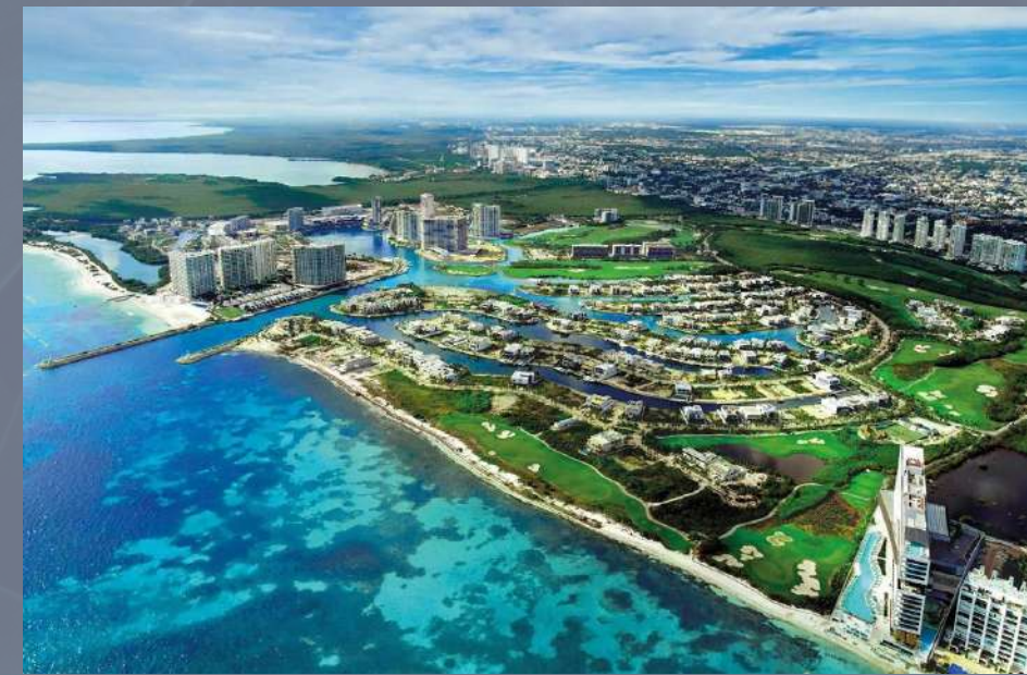
Fracc. Puerto Cancún Cancún, Quintana Roo