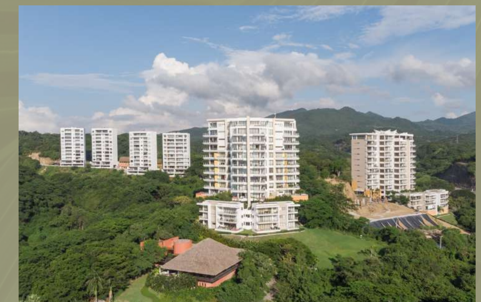
Alamar La Cruz de Huanacastle, Riviera Nayarit