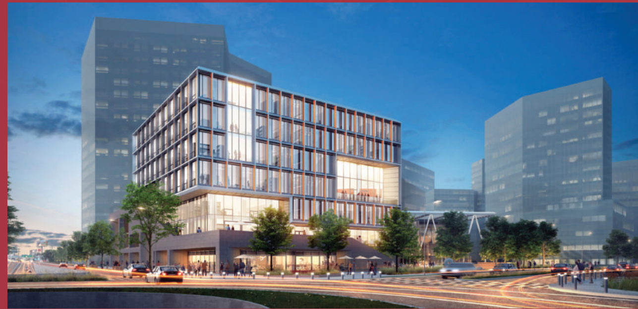
Tecnológico de Monterrey Monterrey, Nuevo León