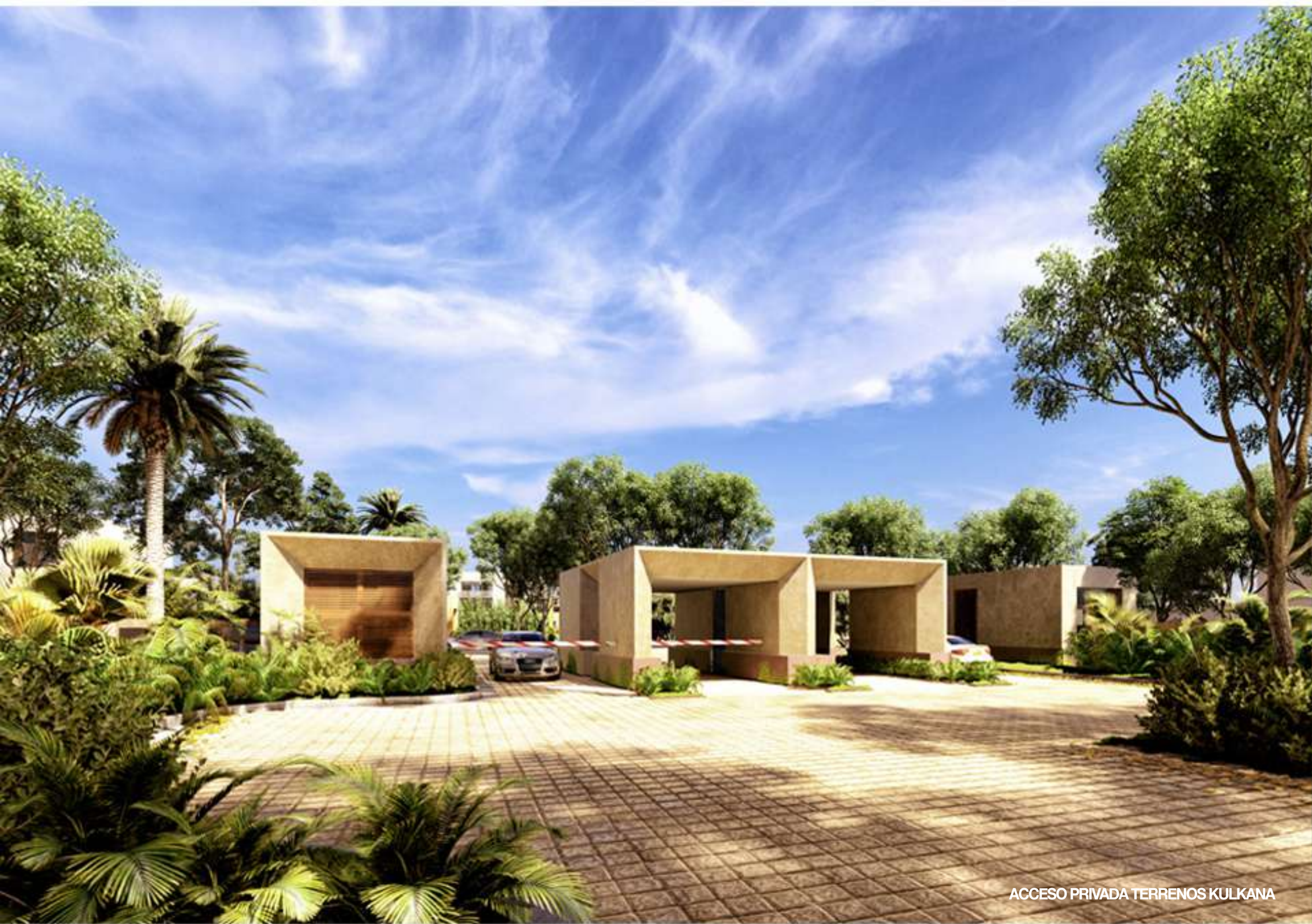
ACCESO PRIVADA TERRENOS KULKANA