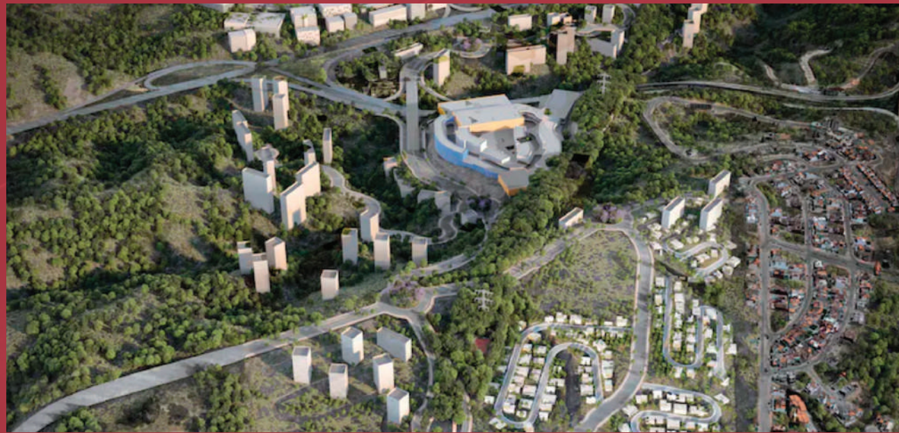
Plan Maestro LATIZ Estado de México, México

La propuesta arquitectónica de KULKANA destaca por la colaboración con despachos de arquitectura de renombre internacional.