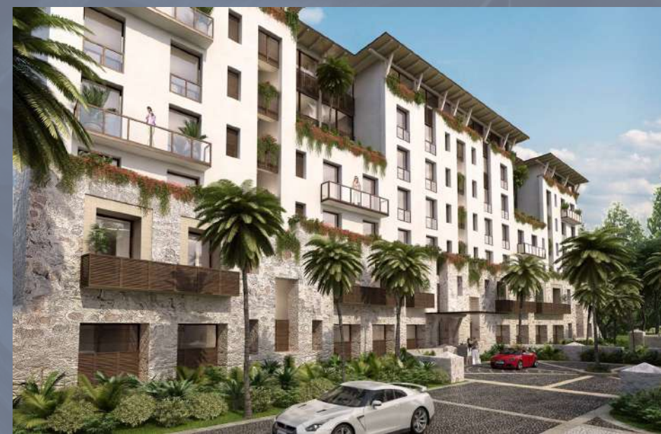
Kaánali Cancún, Quintana Roo