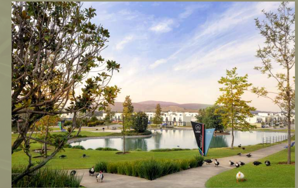
Adamar Zona Metropolitana de Guadalajara, Jalisco