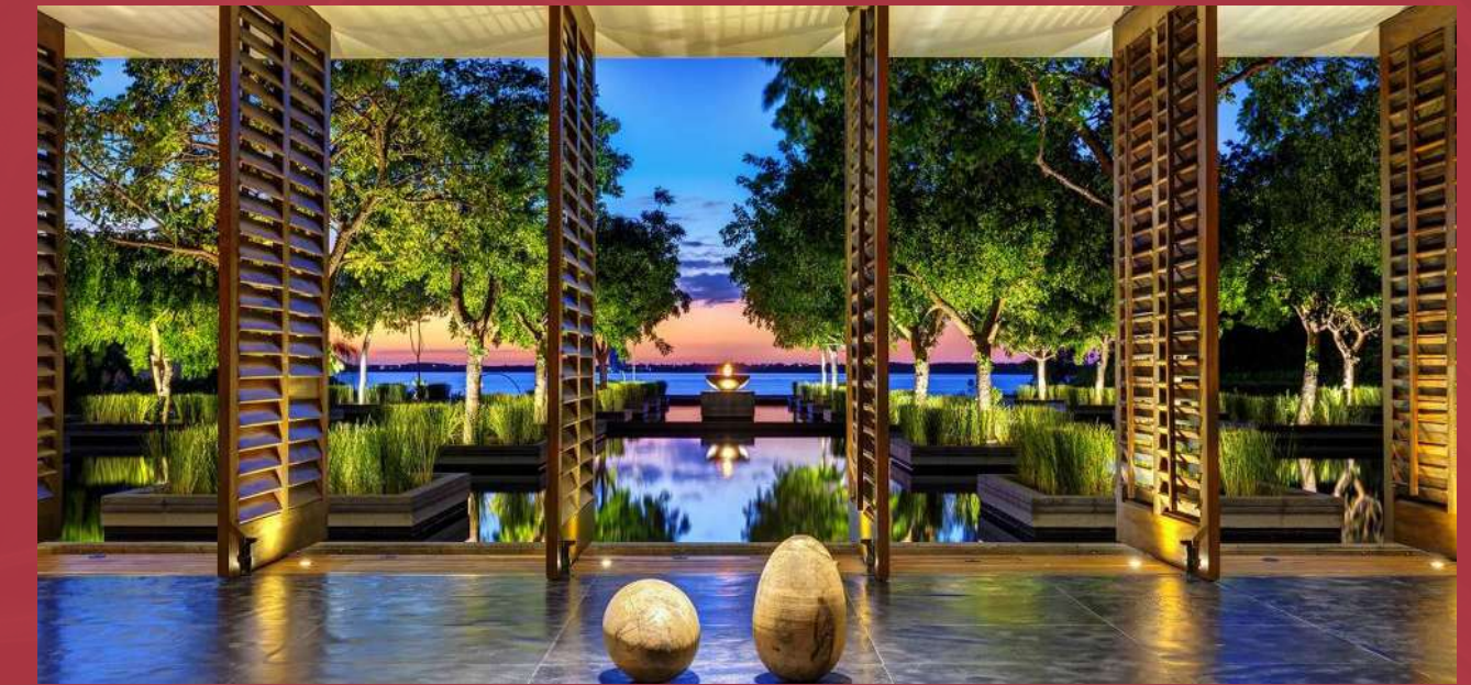
Brisas, Nizuc, Resort & Spa Cancún, Quintana Roo