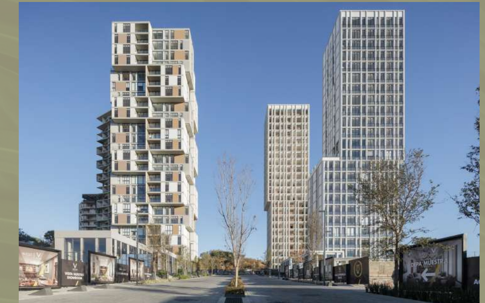
Ventura Zona Metropolitana de Guadalajara, Jalisco