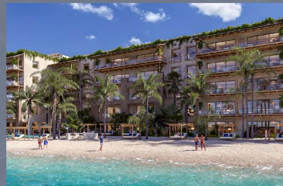
Artila Isla Mujeres, Quintana Roo