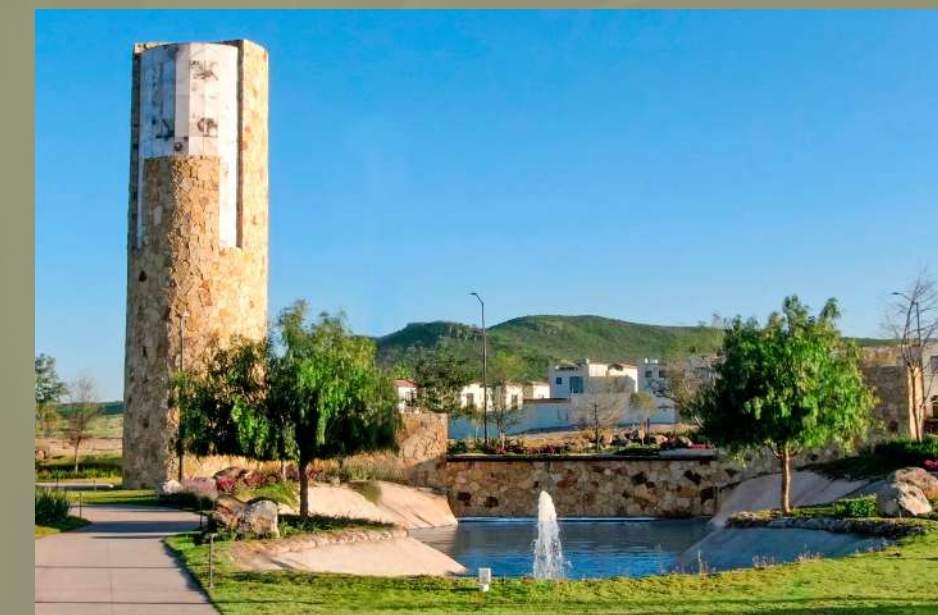
Capital Sur El Marqués, Querétaro