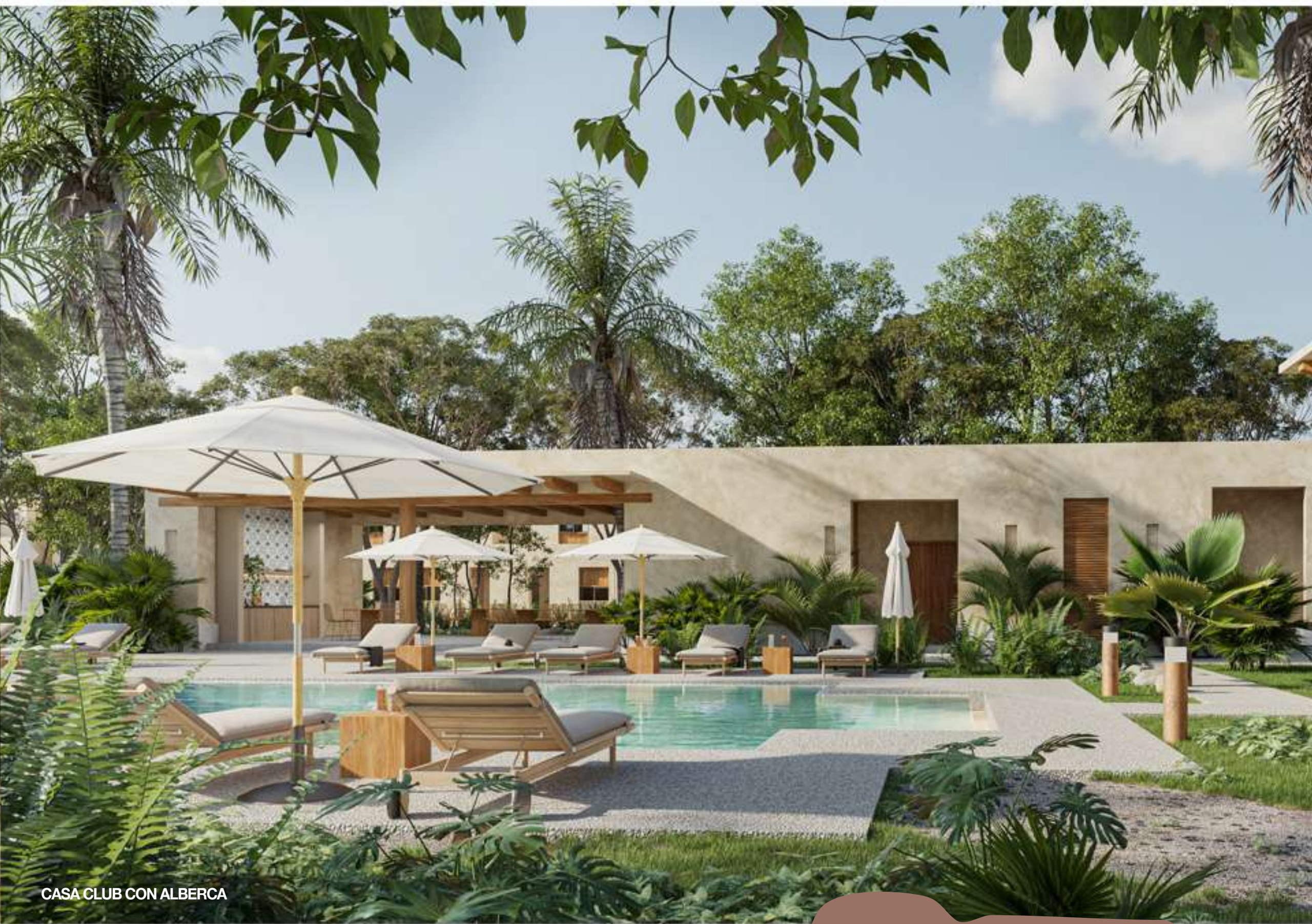
CASA CLUB CON ALBERCA