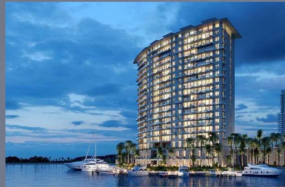
Aria, Puerto Cancún Cancún, Quintana Roo